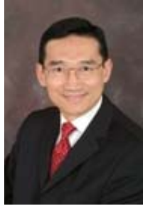
潘永生先生 香港生產力促進局 副總裁 (科技發展)